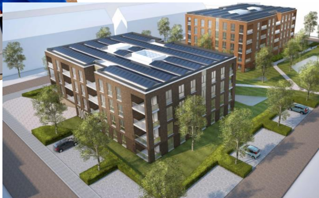
Hoofdstraat Krimpen a/d Lek 63 appartementen