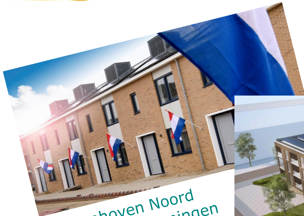
Schoonhoven Noord 62 eengezinswoningen